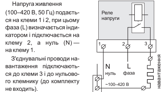
Схема 1. Спрощена внутрішня схема та схема підключення

З'єднання навантаження з мережним нулем в клемі 1 НЕ ЗДІЙСНЮВАТИ!